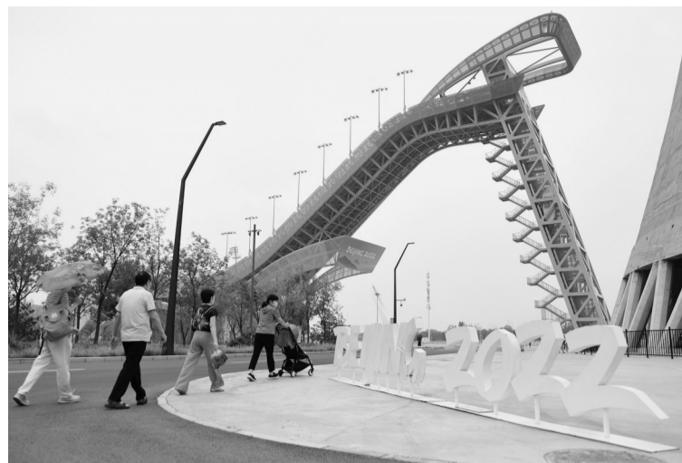
7月2日,北京首钢滑雪大跳台出发区参观恢复运营。游客可在首钢滑雪大跳台一览冬奥赛道及园区风光,感受运动员出发视角。图为游客在首钢滑雪大跳台参观游玩。