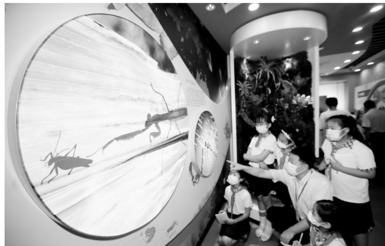
7月1日,山东省青岛市即墨区龙泉街道莲花山小学学生来到中国农业科学院青岛特种作物研究中心试验基地,通过丰富多彩的活动激发了对生物科普的学习兴趣。图为工作人员为小学生讲解生物知识。新华社发