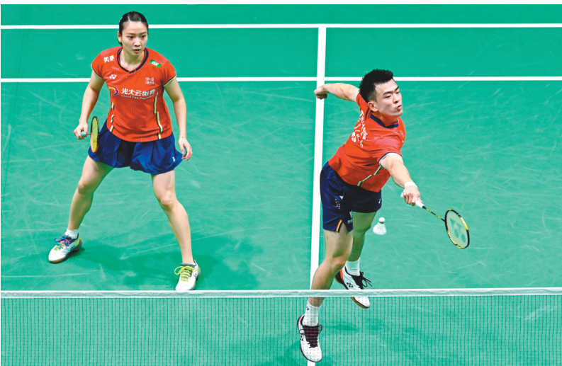
6月29日,在吉隆坡举行的2022年马来西亚羽毛球公开赛混双首轮比赛中,中国选手郑思维/黄雅琼以2:0战胜马来西亚选手许邦荣/杜依蔚,晋级下一轮。图为郑思维(右)/黄雅琼在比赛中。