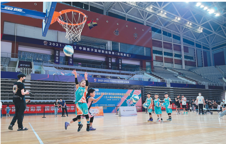
图为“全民菁英”篮球系列赛比赛场面。

在CBA总冠军辽宁男篮的联赛主场里打球是一种什么样的体验?中国体育彩票杯“全民菁英”篮球系列赛,给民间篮球爱好者提供了一个可以尽情挥洒汗水、展示自我的专业舞台。6月25日,第一阶段比赛(U6组)在辽宁体育馆举行。经过一天的较量,鞍师篮途A、龙骑士和国誉体育三支队伍分别获得U6组的前3名。 “全民菁英”篮球系列赛是辽宁省体育产业集团重点推出的自主IP群众精品赛事,依托辽沈地区篮球运动扎实发展基础,结合辽宁男篮联赛主场的稀缺资源,在联赛间歇期为广大篮球爱好者提供了一个走进专业篮球比赛场馆切磋球技的机会。本届赛事由辽宁省体育产业集团场馆运营管理有限公司承办,辽宁省体育彩票中心独家冠名,这也是中国体育彩票第二次冠名该项赛事。