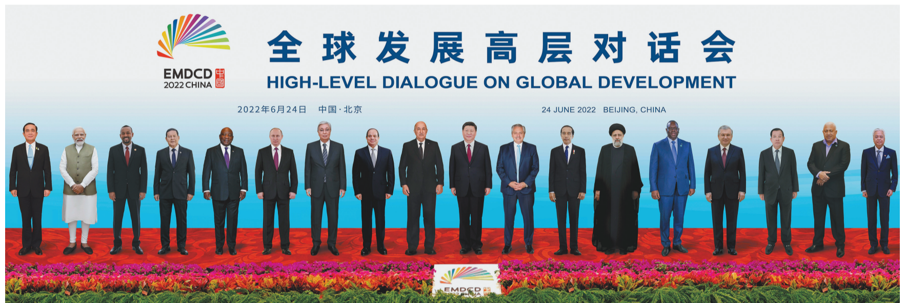
6月24日晚,国家主席习近平在北京以视频方式主持全球发展高层对话会并发表题为《构建高质量伙伴关系 共创全球发展新时代》的重要讲话。这是与会各国领导人的“云合影”。

新华社北京6月24日电(记者杨依军)国家主席习近平24日晚在北京以视频方式主持全球发展高层对话会并发表重要讲话。阿尔及利亚总统特本、阿根廷总统费尔南德斯、埃及总统塞西、印度尼西亚总统佐科、伊朗总统莱希、哈萨克斯坦总统托卡耶夫、俄罗斯总统普京、塞内加尔总统萨勒、南非总统拉马福萨、乌兹别克斯坦总统米尔济约耶夫、巴西副总统莫朗、柬埔寨首相洪森、埃塞俄比亚总理阿比、斐济总理姆拜尼马拉马、印度总理莫迪、马来西亚总理伊斯迈尔、泰国总理巴育出席。各国领导人围绕“构建新时代全球发展伙伴关系,携手落实2030年可持续发展议程”的主题,就加强国际发展合作、加快落实联合国2030年可持续发展议程等重大问题深入交换意见,共商发展合作大计,达成广泛重要共识。