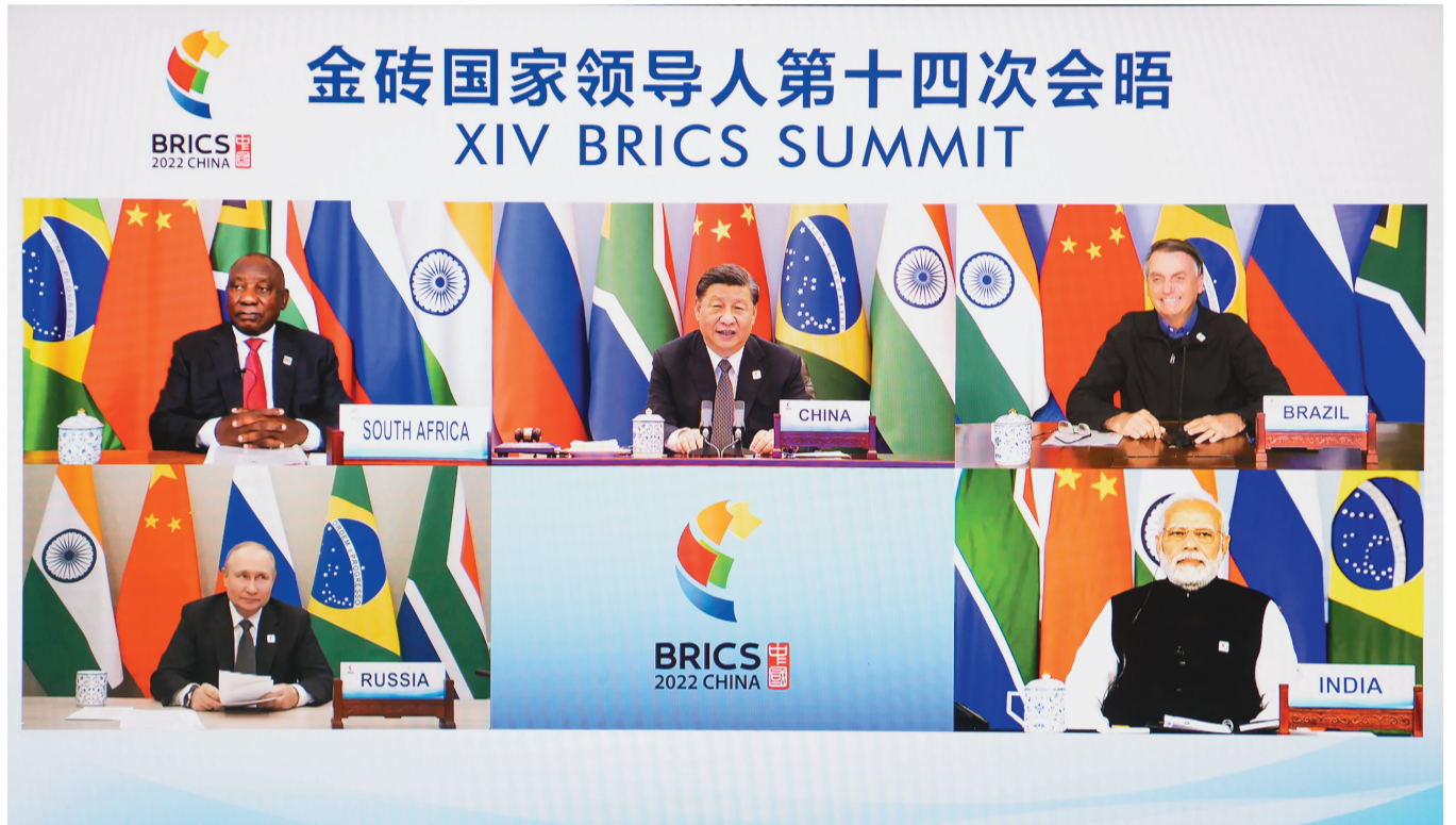
6月23日晚,国家主席习近平在北京以视频方式主持金砖国家领导人第十四次会晤并发表题为《构建高质量伙伴关系 开启金砖合作新征程》的重要讲话。南非总统拉马福萨、巴西总统博索纳罗、俄罗斯总统普京、印度总理莫迪出席。

新华社北京6月23日电(记者杨依军)国家主席习近平23日晚在北京以视频方式主持金砖国家领导人第十四次会晤。南非总统拉马福萨、巴西总统博索纳罗、俄罗斯总统普京、印度总理莫迪出席。 人民大会堂东大厅花团锦簇,金砖五国国旗整齐排列,与金砖标识交相辉映。 晚8时许,金砖五国领导人集体“云合影”,会晤开始。习近平首先致欢迎辞。习近平指出,回首过去一年,面对严峻复杂的形势,金砖国家始终秉持开放包容、合作共赢的金砖精神,加强团结协作,携手攻坚克难。金砖机