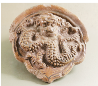
黄琉璃龙纹筒瓦。（海城采集）