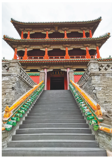
凤凰楼整体风格呈现中原样式，但台基上起楼是典型的女真建筑风格。