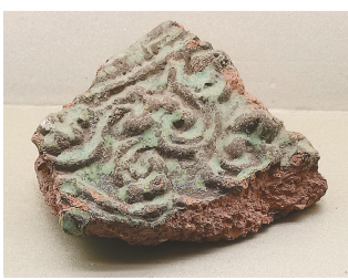
绿琉璃莲花纹滴水。（汗王宫遗址出土）