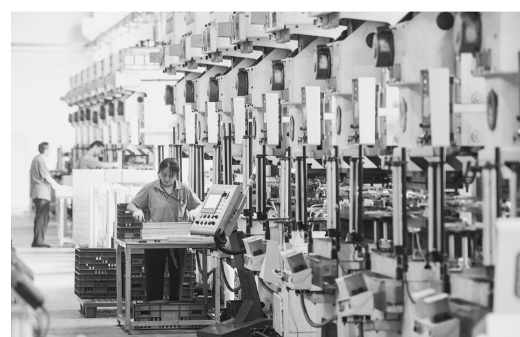
今年以来,重庆市铜梁区通过密集出台涉及工业发展的金融支持、用工保障、科技创新、人才引进等方面系列措施,助企纾困,促进区域企业健康、可持续发展。图为重庆精鸿益科技股份有限公司工作人员在生产车间内作业。