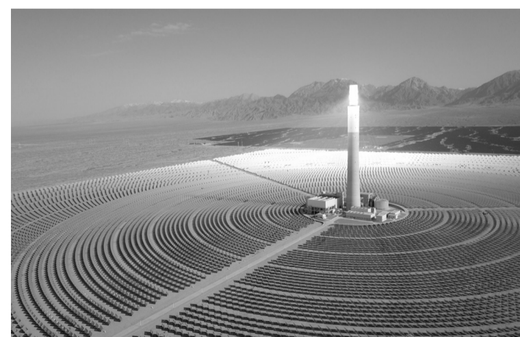
地处柴达木盆地的青海省海西蒙古族藏族自治州在已建成千万千瓦级新能源产业集群的基础上,新开工建设中广核200万千瓦光伏光热项目等5个新能源项目。目前各项目建设工作正在有序推进。图为青海中德令哈50兆瓦光热电站。