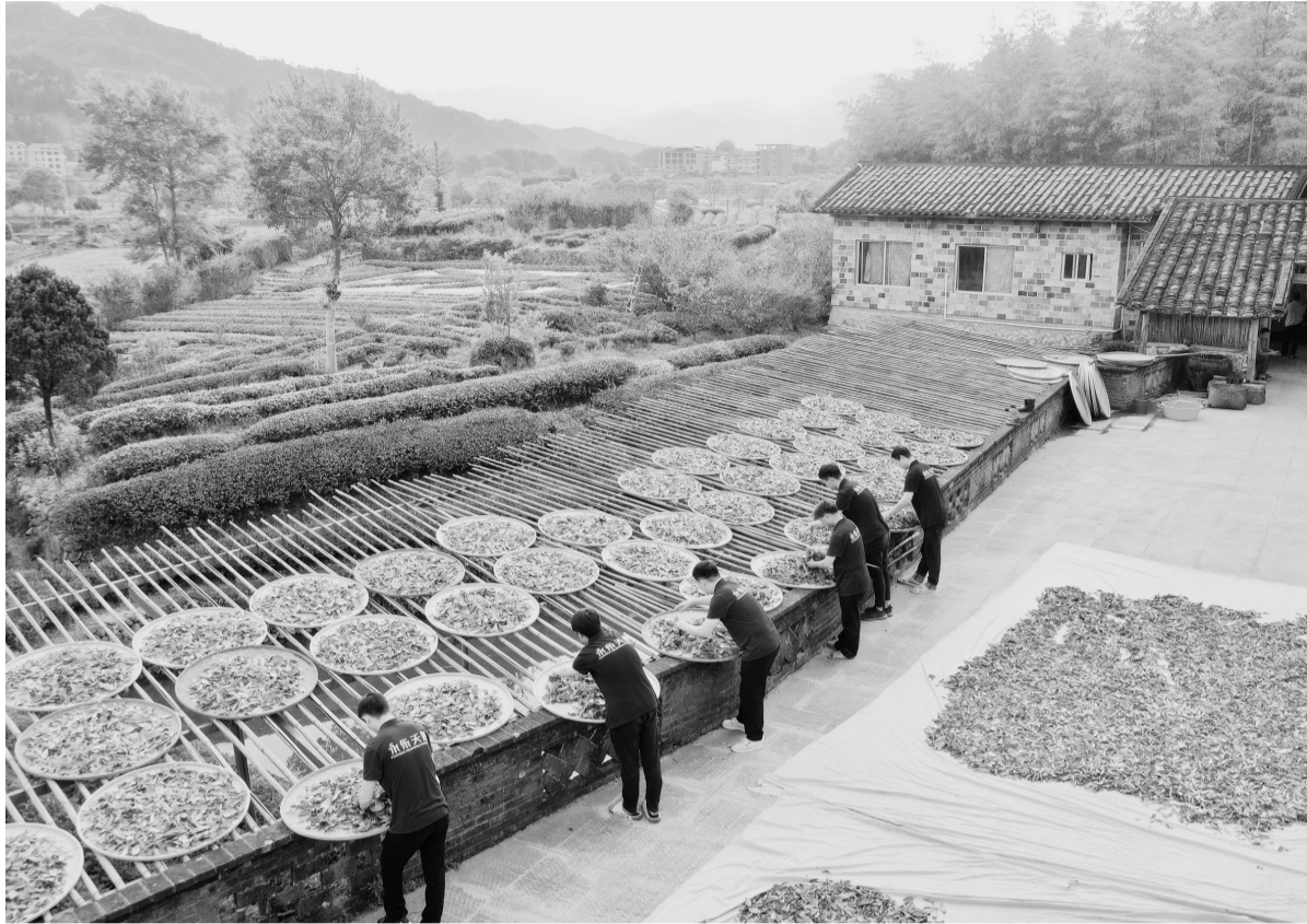
上图:福建省武夷山市星村镇仙凡岩茶厂工人在制作武夷岩茶(5月6日摄,无人机照片)。

2021年3月习近平总书记到闽考察时,希望福建“在全方位推动高质量发展上取得新成效”。蓬勃发展的数字经济,是福建落实总书记重要指示精神,推进高质量发展的缩影。