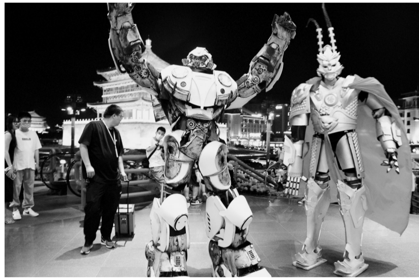
图为西安钟楼附近一商场外工作人员身着影视人物服饰吸引顾客(6月5日摄)。近期,西安市出台多条措施大力发展户外经济和夜间经济,释放消费潜力。