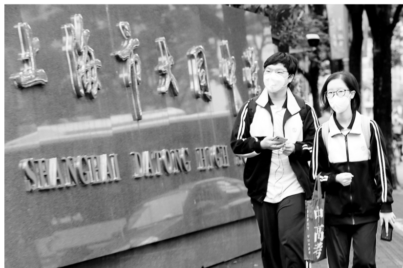
6月6日,上海市大同中学的学生返校。当日,上海全市高三、高二年级学生返校复学。此前,上海已发出通知,秋季高考统考延期至7月7日至9日举行。