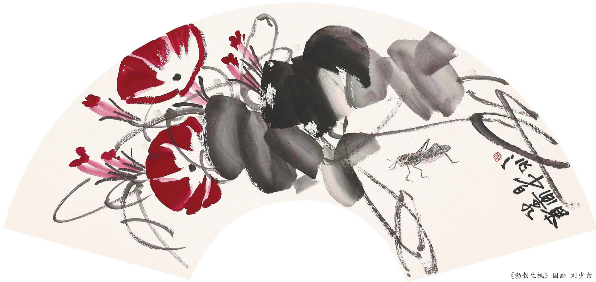
《勃物生机》国画 刘少白