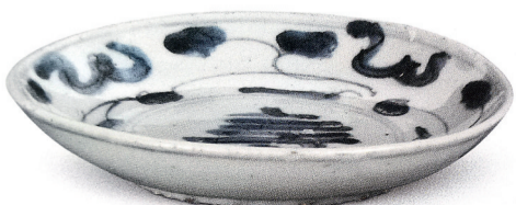
沉船出水的青花寿字纹碟