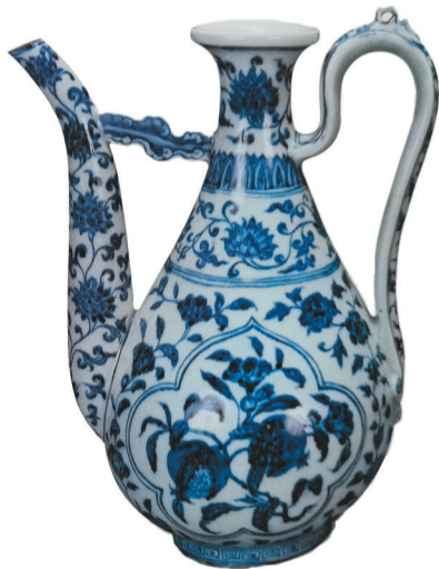
青花蔬果纹执壶(明宣德年间) (辽宁省博物馆藏)