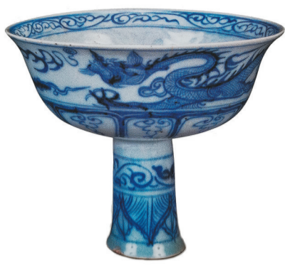
元代青花龙纹高足碗 (辽宁省博物馆藏)

随着海禁的解除，民窑瓷器更是中国对外贸易的活跃品种，有些瓷器甚至是专门为外销定制，因为高度的艺术性和实用性，青花瓷成为世界各国男女老少都喜欢使用的日用器皿和陈设摆件。