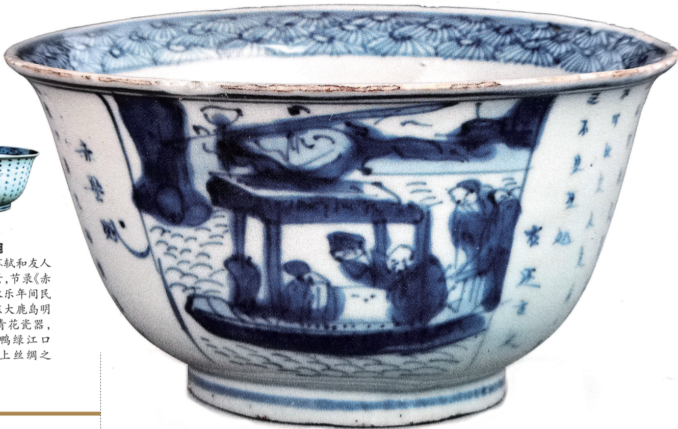
沉船出水的明永乐青花赤壁赋碗

图案是苏轼和友人夜游赤壁场景，节录《赤壁赋》，为明永乐年间民窑烧制。丹东大鹿岛明代沉船出水青花瓷器，进一步证明鸭绿江口海域曾是海上丝绸之路重要节点。