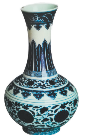
青花缠枝莲赏瓶(清光绪) (辽阳博物馆藏)