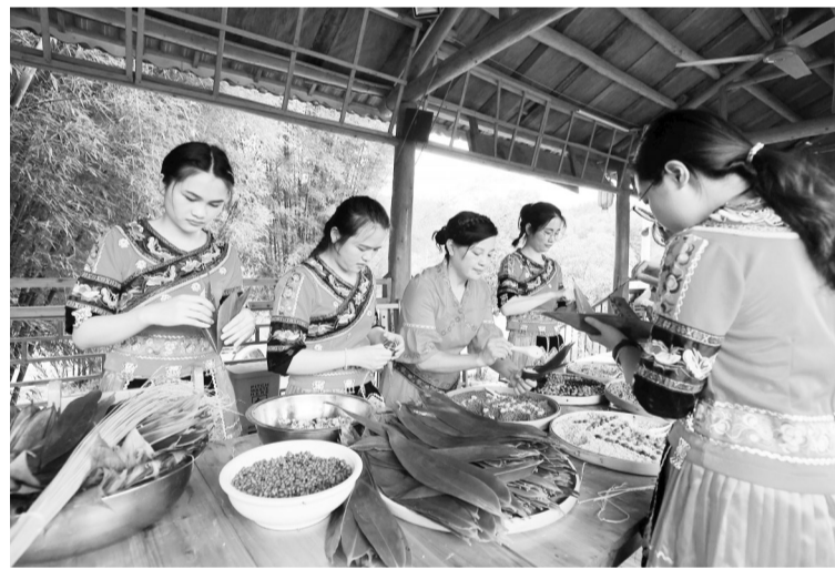
5月25日,在广西融安县雅瑶乡章口村,村民在制作五彩粽子。端午将至,人们用包粽子的方式迎接传统节日的到来。