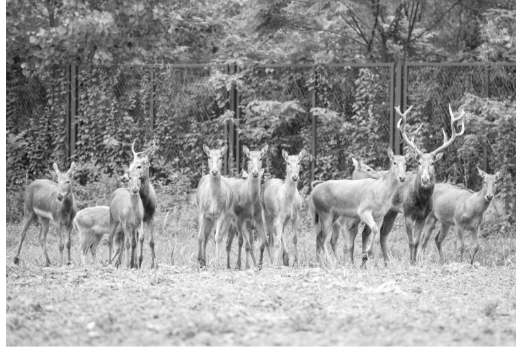
这是5月25日在东洞庭湖麋鹿和鸟类救治避难中心拍摄的麋鹿。东洞庭湖麋鹿和鸟类救治避难中心位于湖南省岳阳市,占地400余亩,自2016年9月中心建成以来就承担起东洞庭湖区域麋鹿的救援、医治、康复和喂养任务。截至目前,该中心共有19只麋鹿正在接受救助。