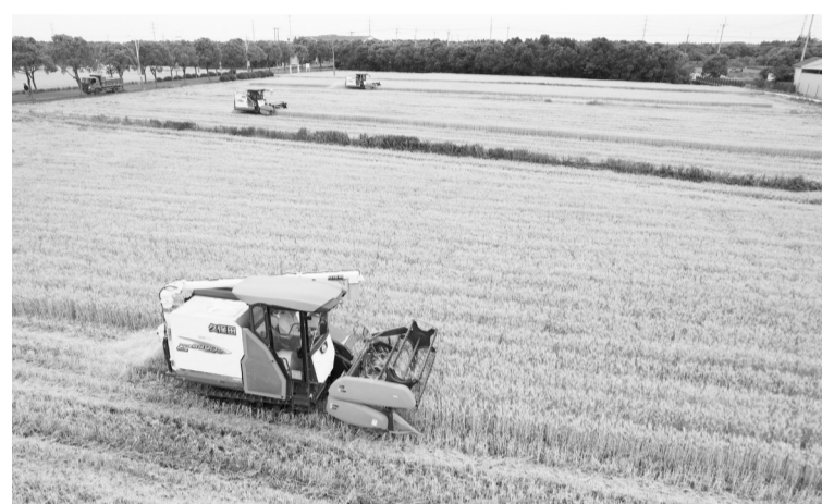
5月23日,在江苏省太仓市璜泾镇雅鹿村,农民驾驶收割机抢收小麦(无人机照片)。南风吹过,麦穗日渐饱满,麦浪下翻涌,金黄的大地一派丰收景象,我国各小麦产区自南向北陆续迎来收获季节。