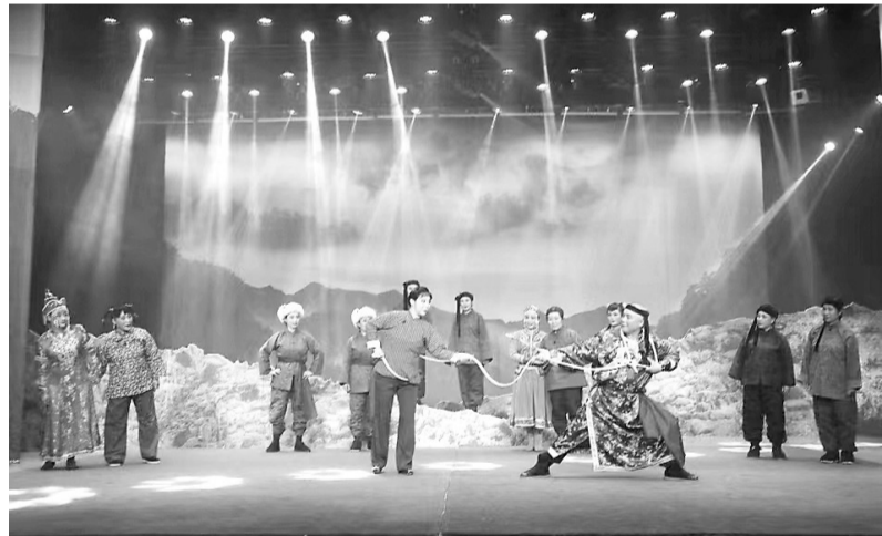
纳入此次“新时代现实题材创作工程”的评剧《烽火映山红》剧照。