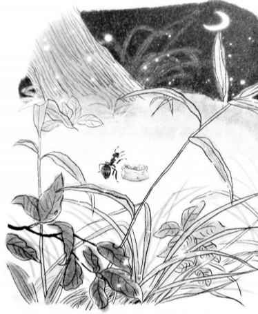
书中的粉土露出来,我变得整个世界都不一样了。《多年蚁后》内页的插图。