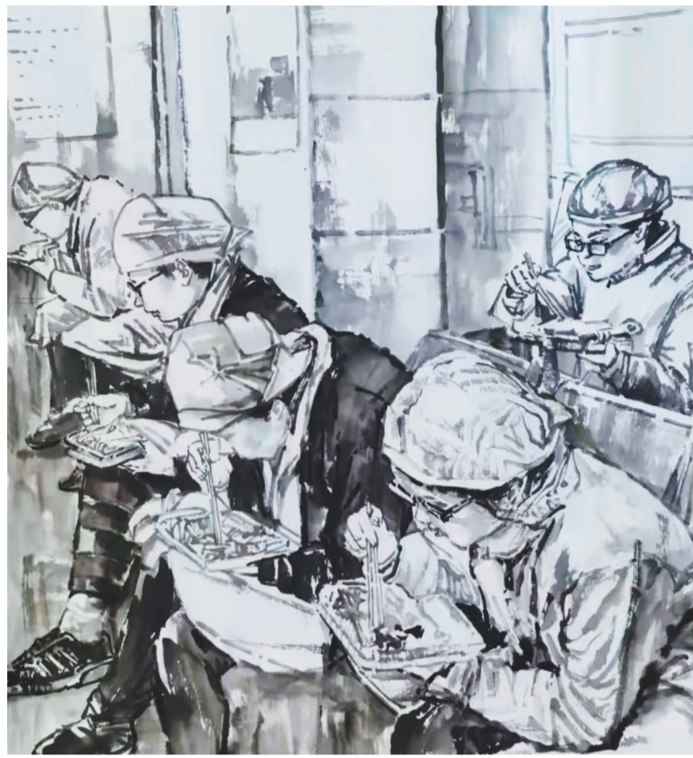
国画《午夜坚守》 宋春雨

核心提示 当前,新一轮新冠肺炎疫情防控工作牵动着每一位辽宁人的心。为充分发挥文艺作品凝心聚力、抚慰心灵的作用,传递众志成城抗击疫情的忘我精神,凝聚共克时艰的正能量,辽宁省、沈阳市文联积极发动各文艺协会创作抗疫作品,用绘画、书法等丰富多样的艺术形式,宣传防疫知识,讴歌奋战在抗疫一线的最美逆行者和志愿者,讲述感人的抗疫故事。