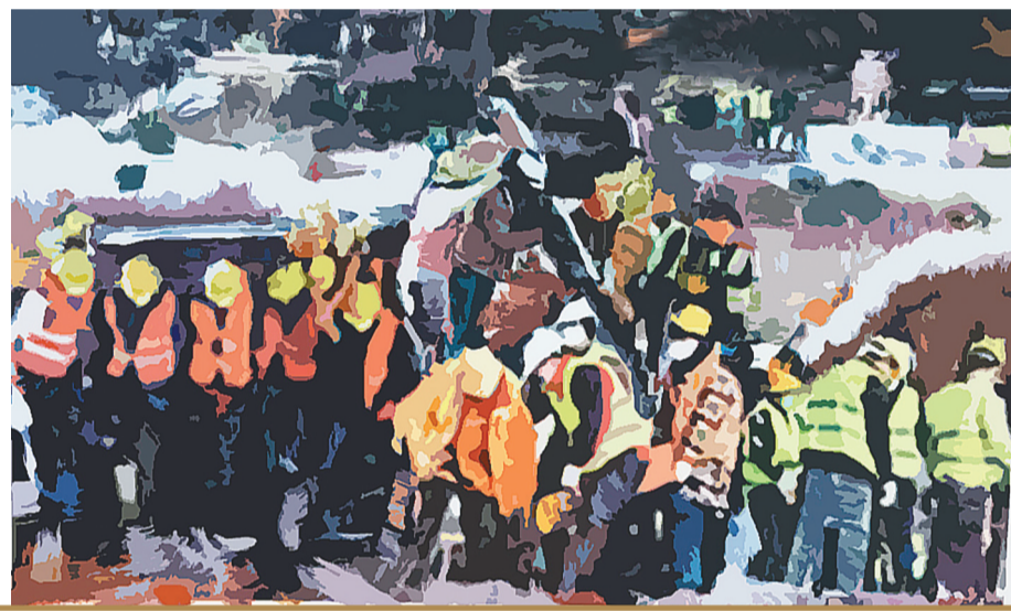
方舱医院(二零二二) 蔡明芸