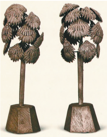
银菩提树。 (朝阳北塔天宫出土)

十分珍贵的历史文化资源。与其他地区相比，独具特色。正因为如此，辽塔对于辽宁来说，可谓是与山西、北京、天津、吉林、黑龙江等省区市也有辽塔分布，但辽宁的辽塔文物保护单位名录的辽塔就有三十四座。虽然在内蒙古自治区、河北、辽宁是辽代古塔资源较为密集的省份。在辽宁境内，仅列入各级