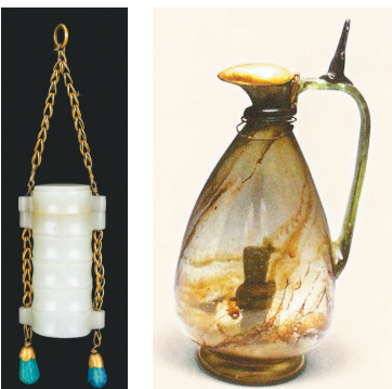
金盖鸟形玻璃壶。 (朝阳北塔天宫出土)