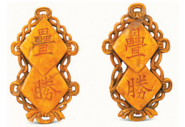
叠胜琥珀盒。 (阜新辽塔地宫出土)