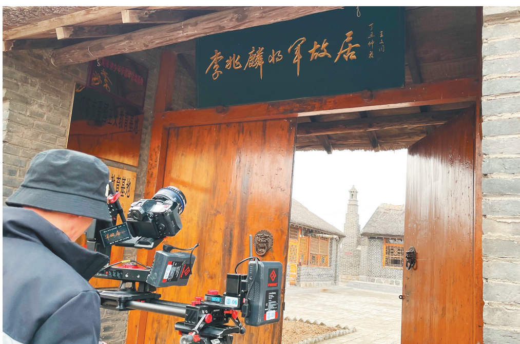
摄制组在李兆麟将军故居前拍摄。