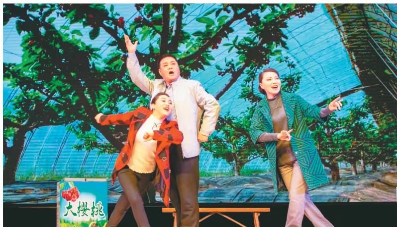
辽剧《春风送暖》舞台照。

流传于海城、鞍山、营口、辽阳一带的民间小戏剧种,源于当地秧歌,主要伴奏乐器是唢呐。最早起源于清嘉庆、道光年间。作为国家非物质文化遗产,海城喇叭戏曲调喜庆、节奏明快,曲风流畅,受到当地群众欢迎。