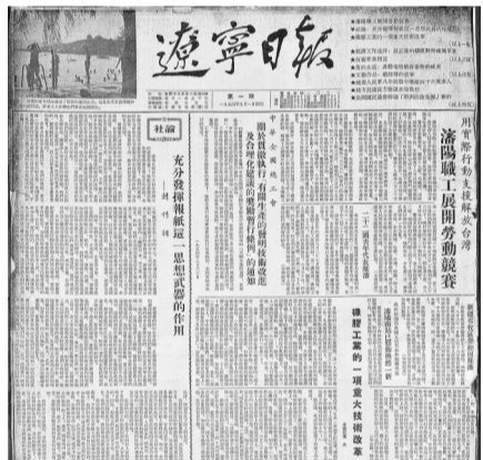
1954年9月1日，《东北日报》更名为《辽宁日报》，这是《辽宁日报》创刊号。