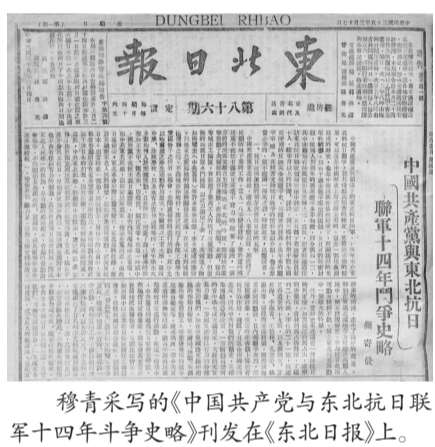
穆青采写的《中国共产党与东北抗日联军十四年斗争史略》刊在《东北日报》上。

1947年2月19日，《东北日报》在一版发表消息《战斗模范杨子荣等活捉匪首座山雕摧毁匪巢 贼匪全部落网》，全文如下： 【本报讯】牡丹江分区某团战斗模范杨子荣等六同志，本月二日奉命赴蛤蟆塘一带便装侦察匪情，不辞劳苦，以机智巧妙方法，日夜搜索侦察。当布置周密后，遂于二月七日，勇敢深入匪巢，一举将蒋记东北第二纵队第二支队司令“座山雕”张乐山以下二十五名全部活捉，创造以少胜多歼灭股匪的战斗范例。战斗中摧毁敌匪窝棚，并缴获步枪六支，子弹六百四十发，粮食千余斤。 这则不足200字的小消息，成为后来文学作品中影视作品创作的素材，“座山雕”因此成为土匪的代名词。实际上，当时东北土匪的主要势力还不是真正的“座山雕”张乐山，而是以李华堂、谢文东、张雨新、孙荣久为首的四股势力，其中谢文东的势力最大。 1946年11月25日，《东北日报》刊登《胡匪谢文东就擒》消息：“窜扰合江解放区年余，荼毒人民无恶不作之谢逆文东匪部，遂告全部肃清，远近人民闻之，莫不拍手称庆。”1946年12月18日，《东北日报》刊登了谭荫溥供稿的《活捉匪首谢文东记》。 消灭谢文东匪帮，是我军在东北剿匪斗争中取得的一个重大胜利。《东北日报》及时报道剿匪过程和战果，对我军剿灭匪徒具有重要参考作用，也极大地提振了广大军民剿匪的士气和信心。