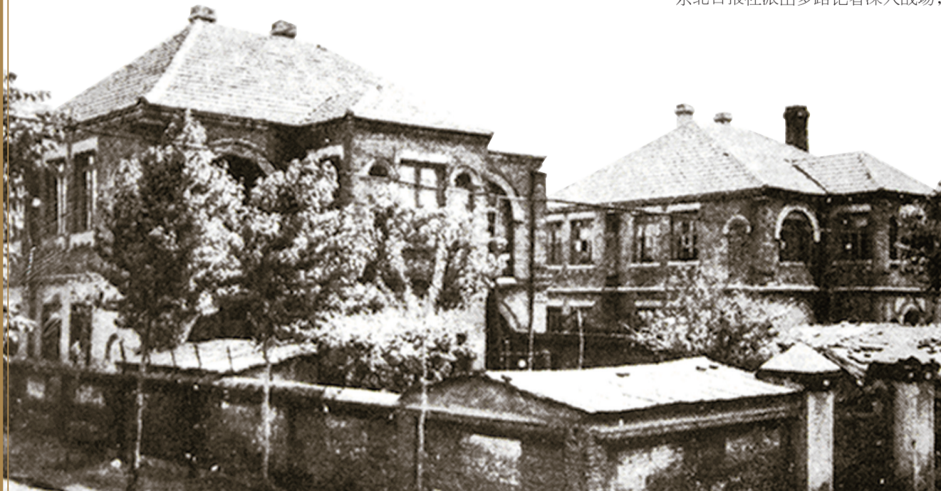
《东北日报》在沈阳创刊时的办公楼。