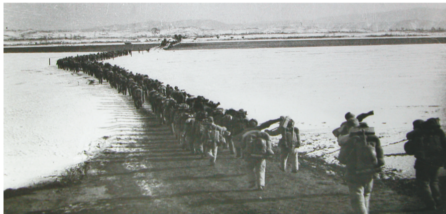
志愿军过江点——丹东市马市村。(资料图)

据悉“抗美援朝出征地”系列展览还将推出“前线的后方 后方的前线”“志愿军空军从这里起飞”等内容,陆续与观众见面。