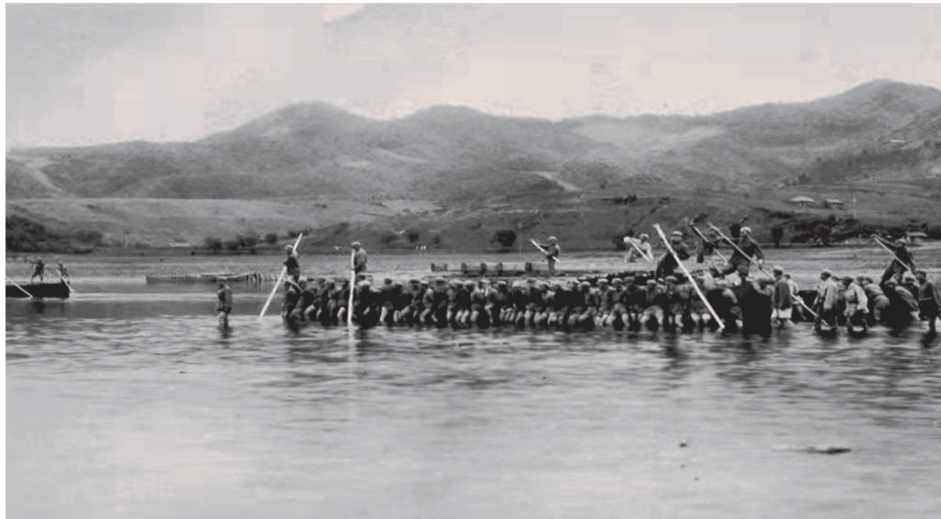
志愿军工兵部队在撤收铁舟浮桥。(资料图)

“中国人民志愿军从这里跨过鸭绿江”展览策展人姜晓杰说,抗美援朝战争期间,丹东市区的两座大铁桥目标较大,是美军飞机轰炸的重点目标,而马市村这座便桥地处偏僻乡村,比较隐蔽,很少遭到敌机的空袭,大批的志愿军后续部队从这里过江,众多的作战物资也从这里运往前线。