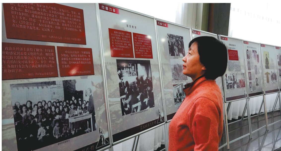
东北解放战争女英模专题展现场。

在3年东北解放战争中,涌现出无数妇女英模,她们不论是在战斗一线,还是在后勤保障中都发挥了重要作用。日前,辽沈战役纪念馆围绕这一群体,策划推出了“巾帼力量——东北解放战争中的女英模专题展”。据悉,这是国内首个以东北解放战争中的女英模为主题的展览。