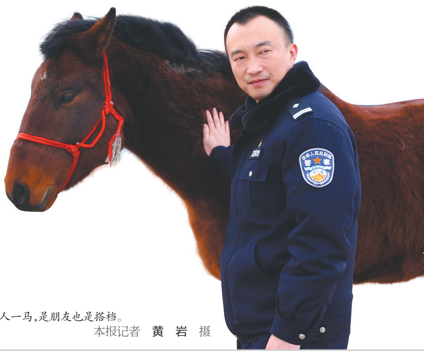
一人一马,是朋友也是搭档。