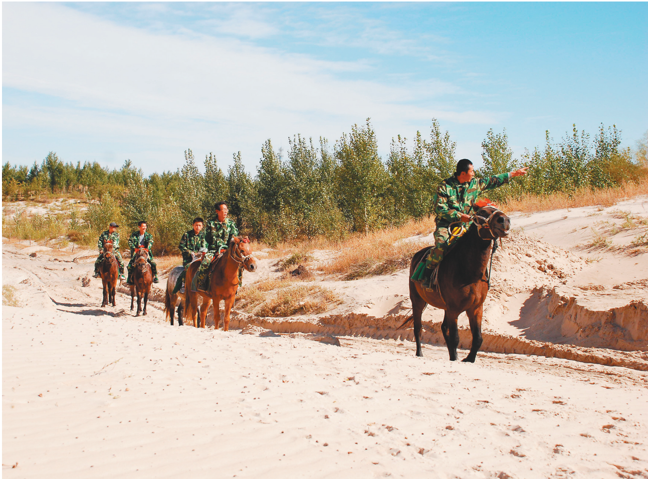
“马背110”在巡逻路上。

25年用心用情守护百姓平安。“马背110”在平凡的岗位上践行着总书记的要求,服务群众,服务发展,也见证了阿尔乡这片土地从黄沙漫天到沙退绿进,百姓从贫困走向富裕的时代进步。