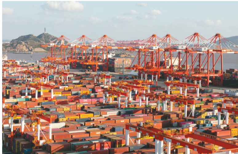
这是上海洋山港集装箱码头。