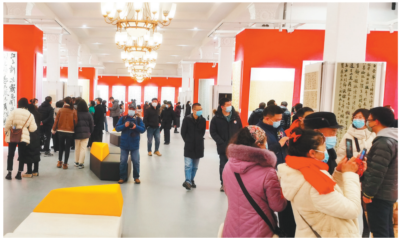
本次展览引起了广泛关注,吸引了各界书法爱好者前来观展。