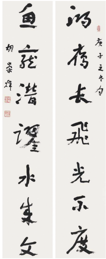
“鸿雁鱼龙”联 胡崇炜 书