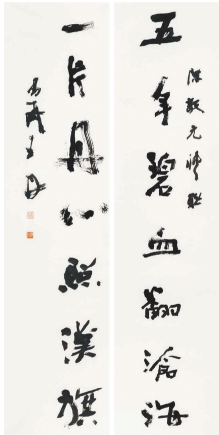
“五年一片”联 王丹 书