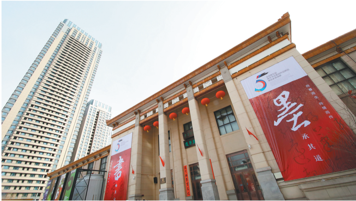
展览在辽宁美术馆举行。

民鉴赏家”称号的杨仁恺先生等先贤,又有在全国取得优异成绩,灿若星辰的中青年书法家,让辽宁书法艺术的未来无限可期。展览成为激励共勉的平台,促进书法艺术勇攀新高峰。