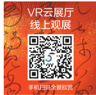
手机扫码全览欣赏