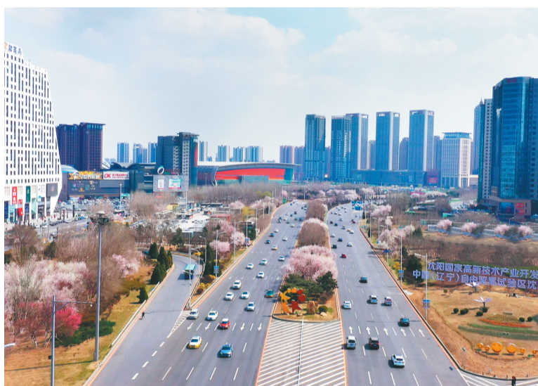
充满创新活力的沈阳浑南区。

规划明确科技城的三大功能定位,即打造沈阳科技创新的策源地、新旧动能转换的发动机、新经济发展的示范区。围绕定位,浑南区创新体制机制、强化配套保障,集聚创新资源,努力把科技城打造成科技创新成果转化和产业化的载体,推动制度创新和数字赋能的引擎,发展新技术、新产业、新模式、新业态的样板。