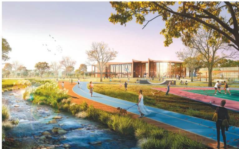
“三生融合”未来之城——沈阳浑南科技城效果图。

空间布局上,科技城将加快构筑“超级十字”发展框架。南北向做强“主轴”,紧密衔接机场与老城区,建设集现代服务业、科技创新、临空经济、自贸区政策于一体的浑南中心;东西向做实“脊梁”,建设统筹科创要素和产业功能区的科创走廊,带动城市和产业升级。