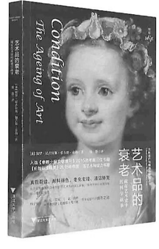
对喜欢艺术史的读者来说,《艺术品的衰老》绝对是不错的一本好书。之前曾在网站看过一个修驴蹄子的视频:一位老师傅笃悠悠地搬来一张凳子坐下...

(如烛火、灯烟和空气氧化的侵染),更是一种时间浸润的结果,这里边包含一种珍贵的历史感,也就是历史沧桑的味道。