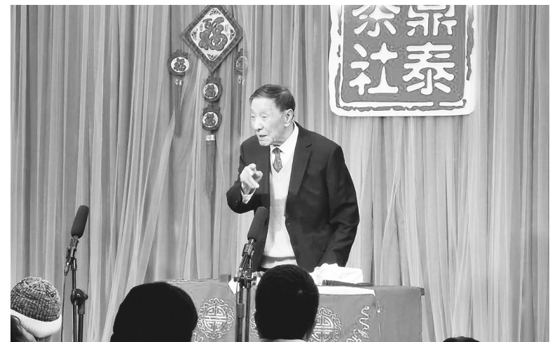
杨振华表演相声《金虎闹神州》。

2月15日晚,沈阳中街古色古香的鼎泰茶社里,86岁的著名相声表演艺术家杨振华用相声助力冬奥,表演了自己最新创作的冬奥主题相声《金虎闹神州》,现场观众深受感染,掌声热烈。