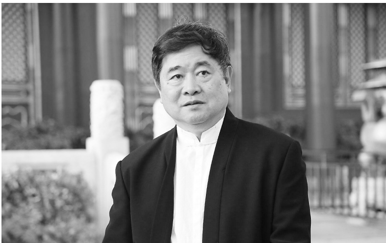
1954年出生于沈阳,祖籍江苏。曾任故宫博物院院长,是第一个走遍故宫的院长,用脚步丈量了故宫,走破20多双布鞋。其策划了故宫夜场、故宫口红和故宫火锅等话题,与故宫共同成为人们心中的网红。此外,他还策划了纪录片《我在故宫修文物》,成功引发了人们对文物修复师的职业向往。

单霁翔告诉记者,辽宁如此多的世界文化遗产,这是辽宁乃至中国为世界人民作出的贡献,同时也是世界人民对辽宁人民在保护文化遗产工作的肯定。