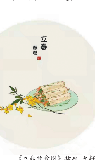
《立春饮食图》插画 无轩

先秦时期，华夏先人在冬至、夏至的基础上进一步细分确立了春分、秋分，后来又确立了立春、立夏、立秋、立冬，至此，二十四节气的骨干——四时八节已完成。到了秦汉时期，随着天文观测方法的不断进步，古人在测量日影的基础上，对太阳黄道（太阳在假想地球上的运动轨道）进行24等分，使每个节气在黄道上都有了一个准确的对照角度。