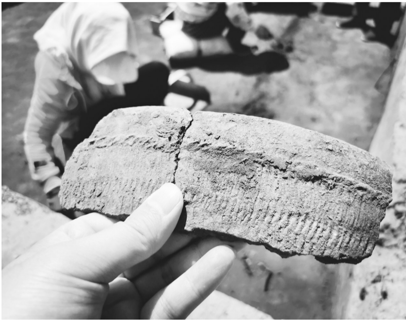
马鞍桥山遗址发掘出土的陶片。(资料图)

一地点共分布着4处建筑址,女神庙是第一建筑址;在女神庙的北侧,相距约10米左右的地方,是被俗称为“大平台”的第二建筑址。按照以往认知,第二建筑址的“大平台”与女神庙是各自独立的建筑,但随着发掘不断深入,这两处建筑很可能是同一个大型建筑的组成部分,而连接区域则是考古工作者今年将深入发掘的9号台基。 郭明表示,如果可以确定女神庙、“大平台”和9号台基是统一整体,那么,一方面可以证明,这里是红山先民的公共空间,是他们举行重要活动的场所;另一方面也可以证明,距今5000年前的红山先民已经有了整体统一规划意识,这是文明进步的体现。