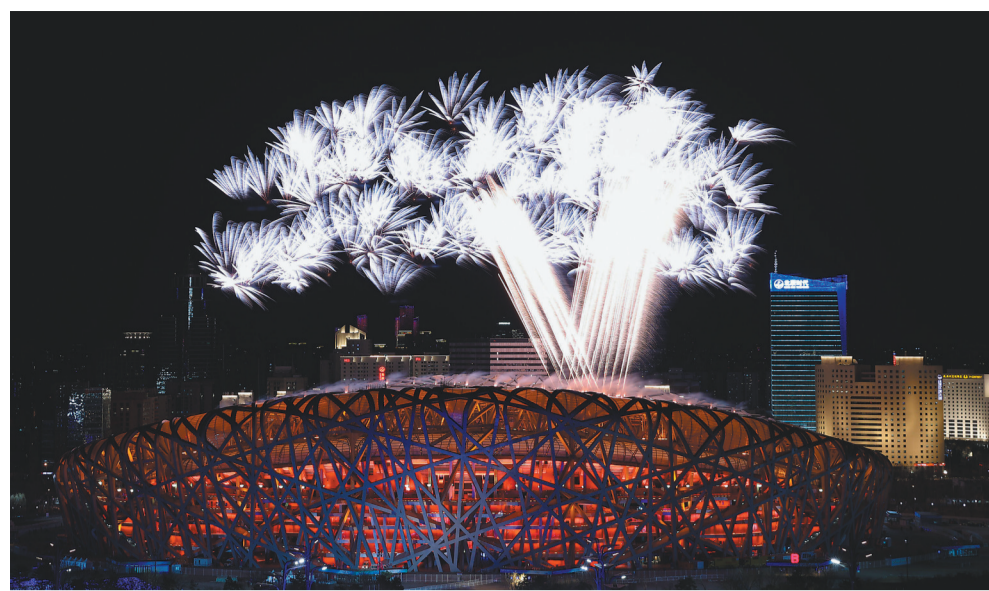
二月四日晚,第二十四届冬季奥林匹克运动会开幕式在北京国家体育场举行。这是焰火表演。