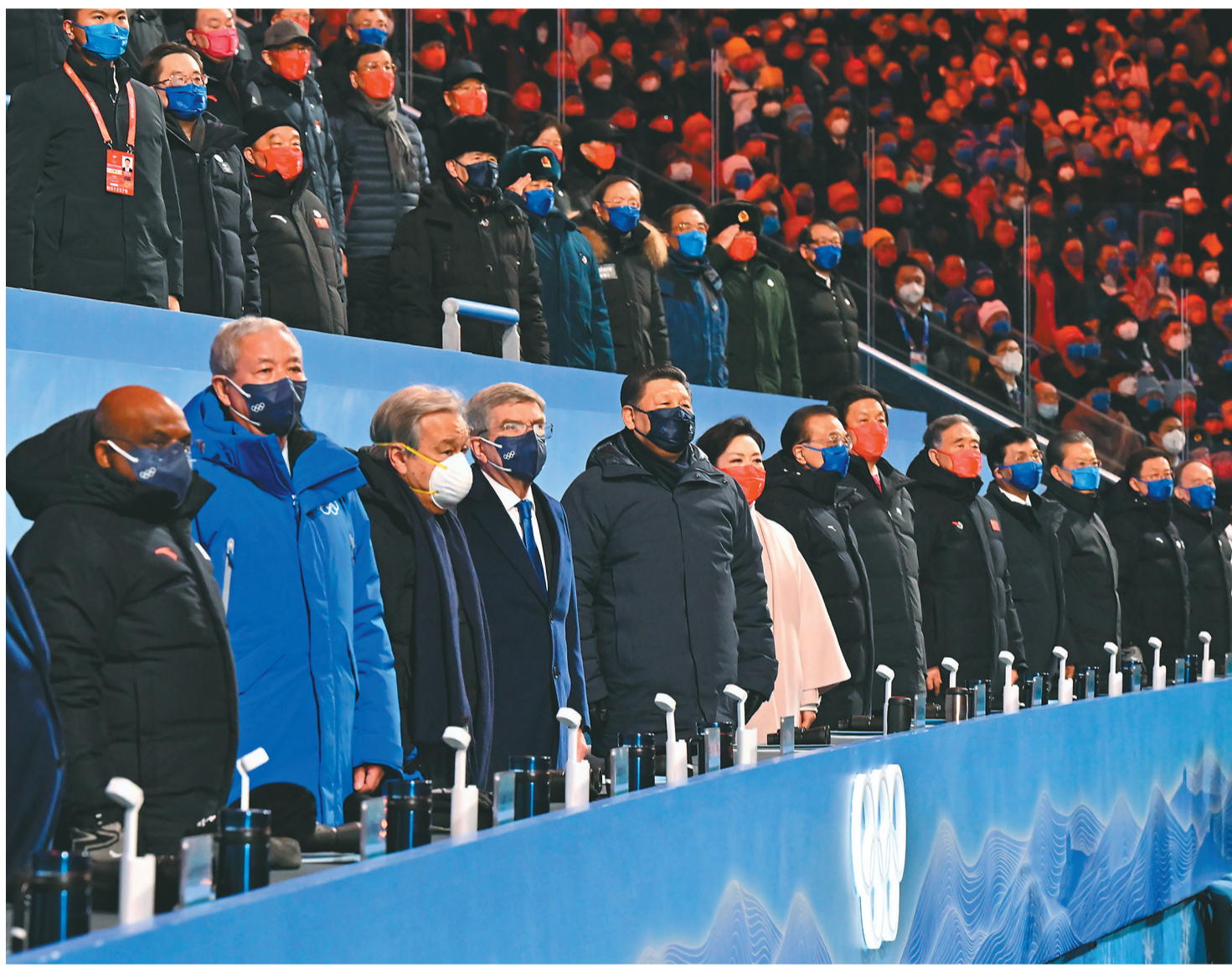
2月4日晚,北京第二十四届冬季奥林匹克运动会开幕式在国家体育场隆重举行。习近平、李克强、栗战书、汪洋、王沪宁、赵乐际、韩正、王岐山等党和国家领导人出席开幕式。

新华社北京2月4日电 筑梦冰雪,同向未来。2022年2月4日晚,举世瞩目的北京第二十四届冬季奥林匹克运动会开幕式在国家体育场隆重举行。国家主席习近平出席开幕式并宣布本届冬奥会开幕。中华文明与奥林匹克运动再度携手,奏响全人类团结、和平、友谊的华美乐章。