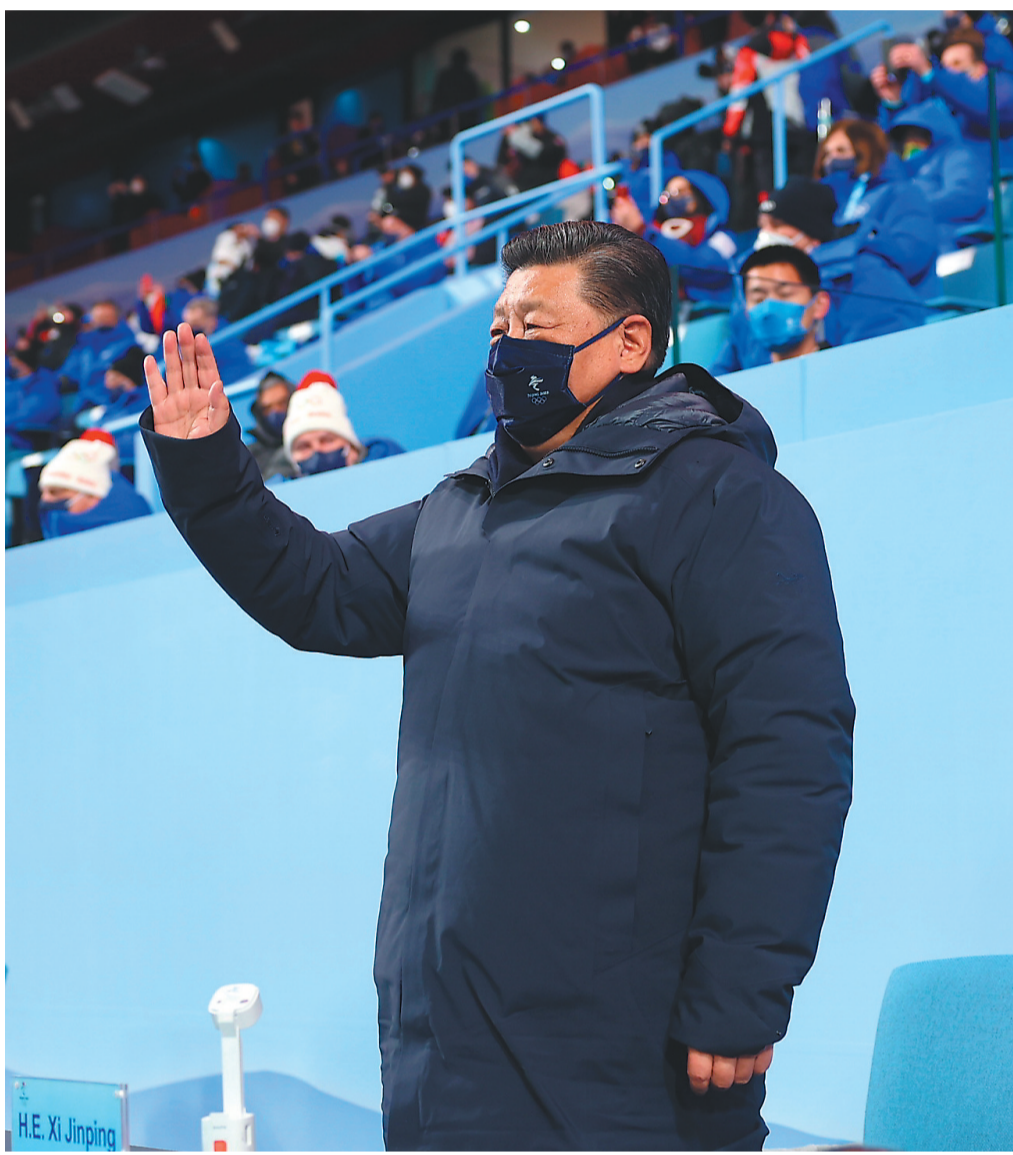
2月4日晚,北京第二十四届冬季奥林匹克运动会开幕式在国家体育场隆重举行。这是国家主席习近平在主席台上向大家挥手致意。

李克强栗战书汪洋王沪宁赵乐际韩正王岐山 国际奥委会主席巴赫来自世界各地的领导人和贵宾等出席