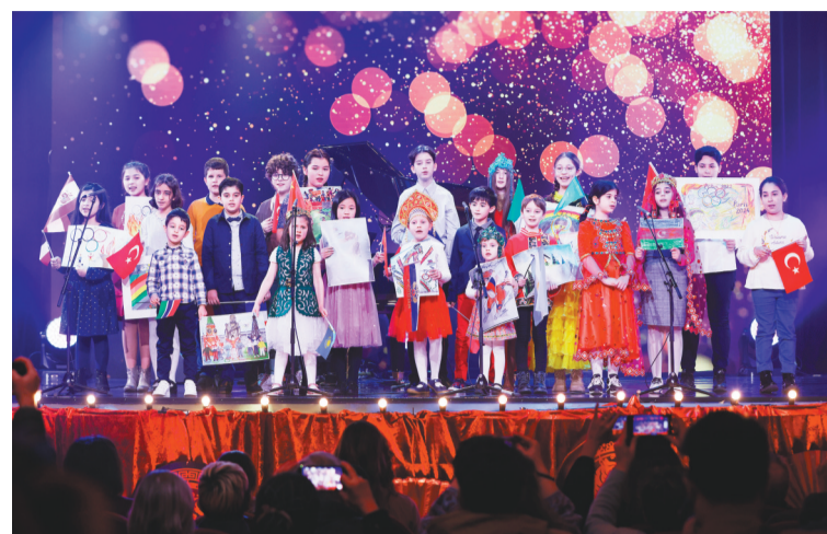
1月26日,在法国巴黎,联合国教科文组织儿童合唱团在“和平·友谊·爱”冬奥新春音乐会录制现场演唱歌曲《和平》。由近百名中外艺术家共同参演,在中国和法国分头录制的“和平·友谊·爱”冬奥新春音乐会2月1日晚通过法国国际电视五台面向全球播出。