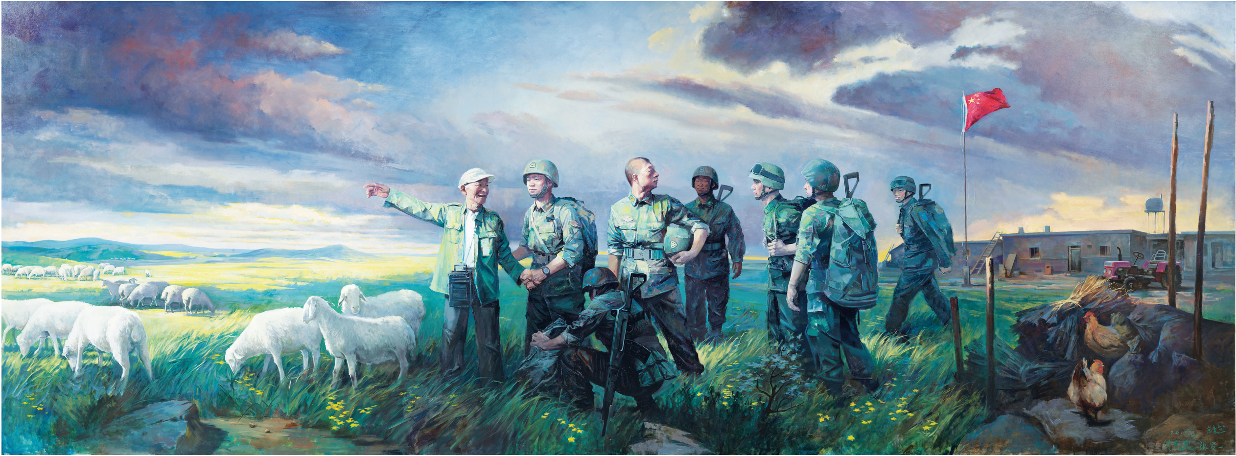
《边境线上的活界碑——魏德友》油画 牟达器 付巍巍 张贵一