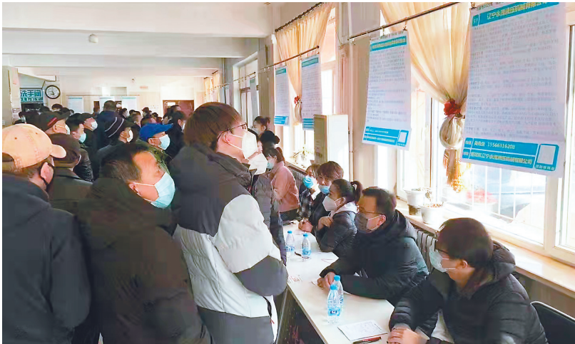
招聘会现场人头攒动。

在政策端做“加法”,加大减负稳岗力度。抚顺市统筹抓好当前政策和延续性政策同步落实,落实好以工代训、就业见习、创业场地补贴、小额担保贷款等政策,发挥政策组合效