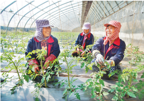
特色农业拓宽农民致富路。