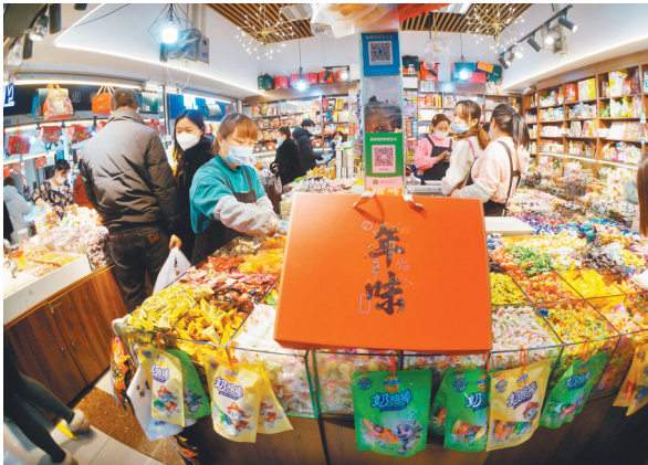
商贸服务业大发展让市民购物更方便。