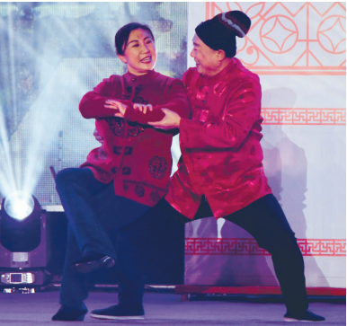
小品《咱们村里的幸福嗑儿》。