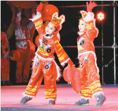
孩子表演《火火的中国》。