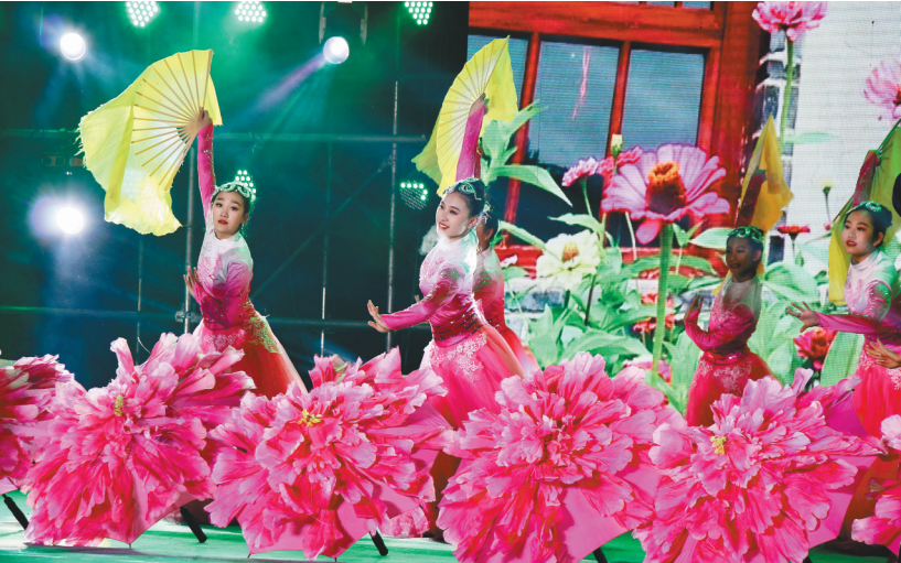
舞蹈《咱农民的胸怀比天宽》。

从朝阳县走出的抗日民族英雄赵尚志将军,是朝阳人的骄傲。赵尚志矢志抗日,带领东北抗日联军叱咤白山黑水,英勇抗击日本侵略者,为中华民族的独立解放献出了年轻的生命。电视剧《赵尚志》的播出,让那首动情的主题歌《嫂子颂》红遍了大江南北,舞蹈《嫂子颂》是以主题歌《嫂子颂》“于诚庭文化大院农民村晚”“南公营依托编排的舞蹈,演员们的表演生动感人。