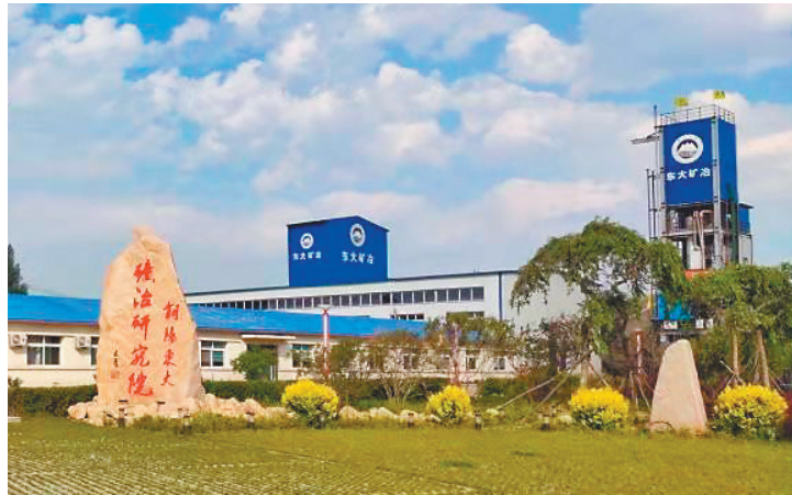
开发区科技创新示范企业——朝阳东大矿冶工程技术有限公司。

现在,走进朝阳柳城经济开发区,一条条宽阔平整的道路纵横交错,一排排现代化厂房拔地而起,一台台机器设备正在安装调试,一车车产品从这里运往大江南北。入园企业从建园之初的寥寥数家,发展到现在的81家,工业总产值从最初的几百万元增至现在的十几亿元,开发区经济实现了从无到有的华丽转身。