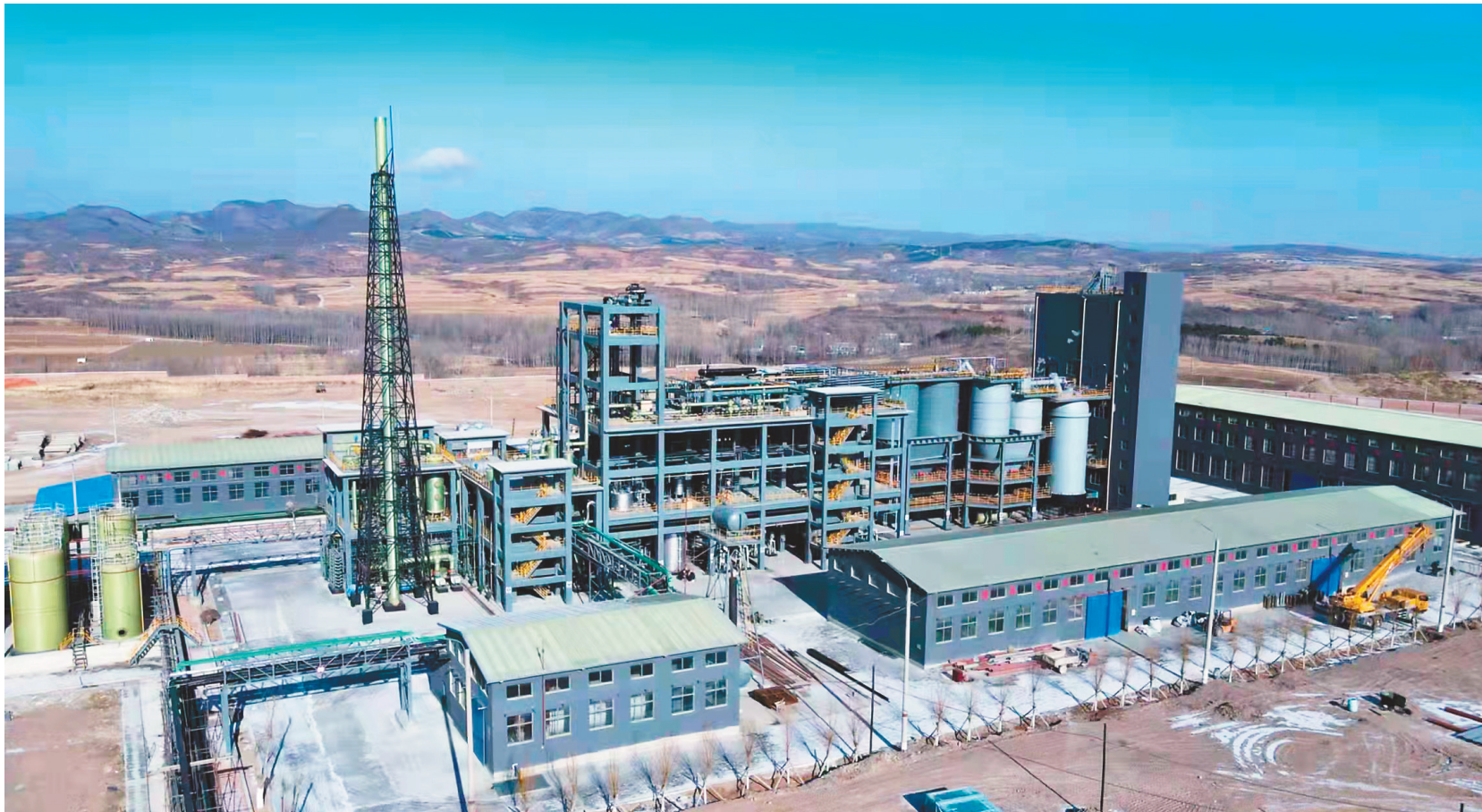
朝阳百盛钛业股份有限公司厂区。

装备制造产业集群发展。以优尼斯智能制造、联强轧辊、亿联盛轧辊等企业为代表,全力推进重点项目建设,打造现代机械装备制造产业基地。目前,关联企业达到30家,2022年拟再引进产业链项目15个,争取到“十四五”期末产值突破80亿元。