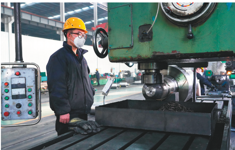
辽宁亿联盛轧辊有限公司机加车间工人正在调试机器。