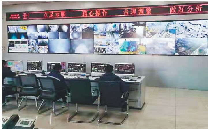
朝阳能环新能源科技有限公司生物质能发电中控室。