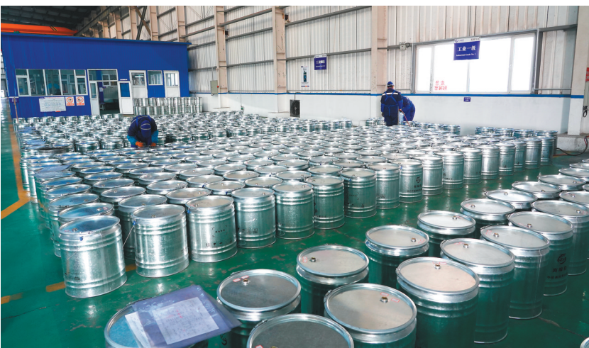
辽宁华铝新材料有限公司海绵锆精整车间生产场景。