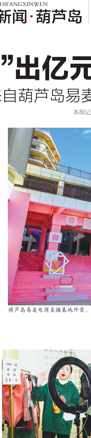
葫芦岛易麦电商直播基地外景。

以往的电商购物1.0版，比如天猫、淘宝等平台，都是消费者有了购物意愿才会去打开网页挑选。因为