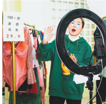
主播正在直播带货。

“这就是机会。”兴城人认为，无论电商还是直播，都属于虚拟经济范畴，信用是发展要义。而葫芦岛易麦电商直播基地的国资国企背景，恰恰可以为这里的电商直播做最好的信用背书。