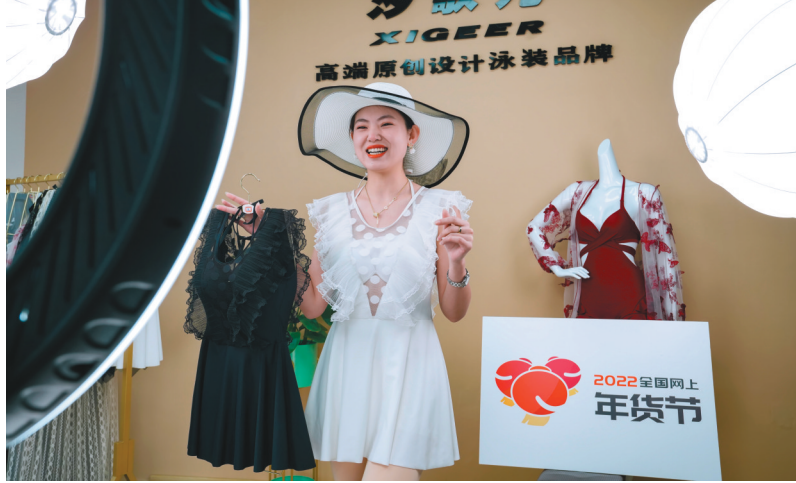
主播在直播带货过程中向“粉丝”展示泳装穿搭效果。

2021年春节期间，易麦电商直播基地始终灯火通明。基地运营的50多名员工没有回家过年，一起在这里昼夜奋战。“亏损的压力，盈利的渴望，驱使我们不敢停歇，拼命奔跑。”偏居辽西一隅，他们生怕一不小心就掉队了，每天都与一线城市同行保持着紧密沟通。基地在广州设立了一个直播分部，与广州这个全国电商直播之都实时信息互通，确保这里始终拥有与一线城市企业比肩的高运营效率。