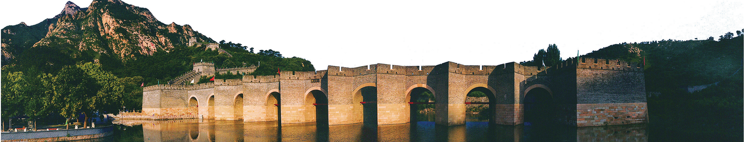
辽宁长城资源丰富,这是位于葫芦岛的独一无二的水上长城——九门口长城。