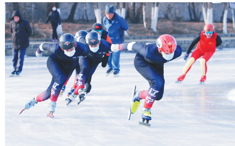
省短道速滑队队员在活动现场进行滑行展演。

辽宁省短道速度滑冰队的运动员、教练员,与年逾七旬的老年滑冰爱好者同场竞技。如此“混搭”的冰雪运动场景上周末出现在沈阳万柳塘公园的冰面上。