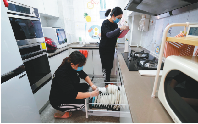
一单收纳的生意,包括了客户咨询、上门量尺、确认细节、设计方案、购买工具、上门收纳几个部分。