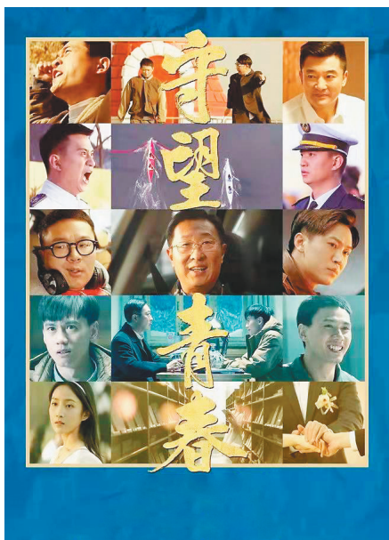
电影《守望青春》海报。

而电视剧《霞光》作为一部非典型的谍战剧,以“反套路”的叙事模式与“复合性”的内在机制拓宽了谍战类型影片的叙述模式。国庆假期之后,该剧在央视和爱奇艺、腾讯、优酷等网络平台同步播出,创造了全网电视剧收视第一的佳绩。