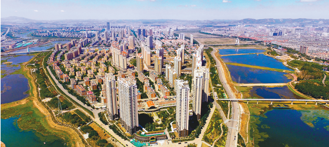
三山环抱、三水萦绕的锦州城。

北普陀山、南山、紫荆山,这三座青山环抱让锦州更加清秀。南山,从一座万亩荒山到一个生机盎然的市民休闲旅游之地,这是锦州建设宜居城市的重大举措。走进南山公园,沿登山栈道慢行,路两边的京桃、五角枫等树木随处可见。南山公园治理前是一片缺水的荒山,开始修复后,第一件事就是引水上山,把女儿河的水引到了山上之