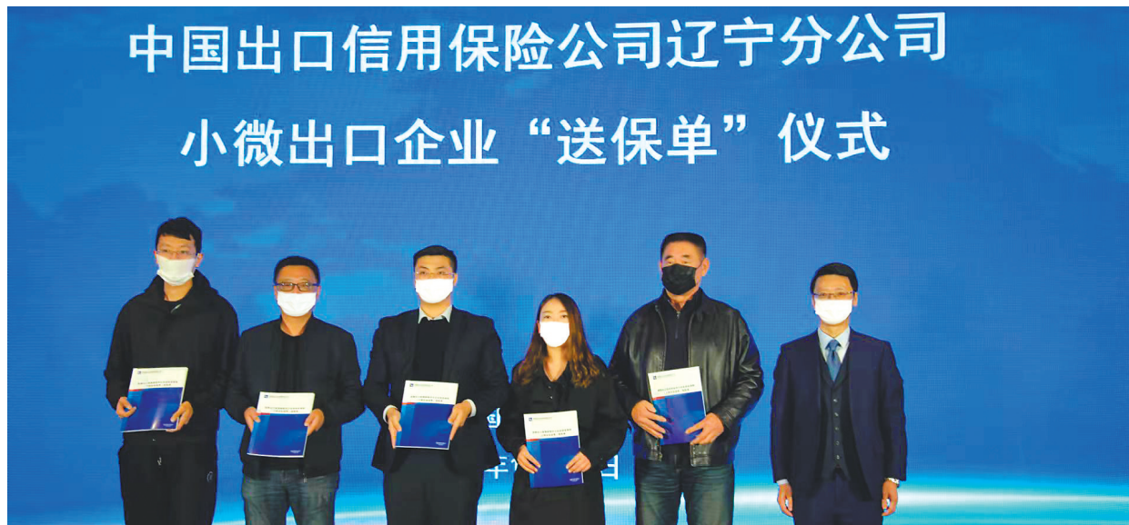
中国信保辽宁分公司护航小微出口企业“走出去”。

多年来,中国信保辽宁分公司全面贯彻“一带一路”倡议及“东北振兴”等国家战略,全力服务实体经济、防控业务风险,助推辽宁开放型经济建设,不断加大对外贸的支持力度,为辽宁经济社会发展作出了应有贡献。