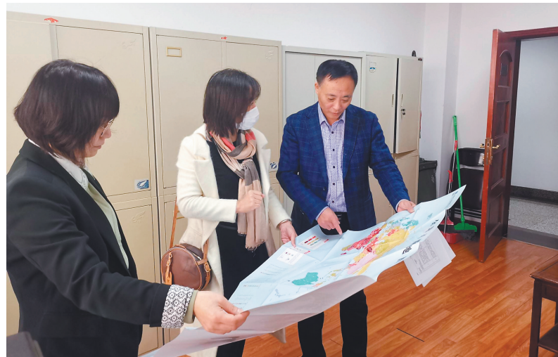
中国信保向省工信厅递送风险报告,助力辽宁外向型经济发展。

系,在充分发挥保险风险补偿功能的基础上,为企业提供完备的信用风险解决方案和融资增信支持。截至2021年12月,中国信保辽宁分公司累计支持辽宁国际贸易和投资超过1336亿美元,出口信用保险渗透率达30%,累计向客户支付赔款42.5亿元,为企业提供短期险保单融资增信支持792亿元,支持项目险融资424亿元,为辽宁外经贸高质量发展提供了有力支撑,在稳增长、稳金融、稳就业、缓解企业出口难、融资难等方面作出了积极贡献。