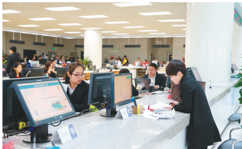
市民在辽宁自贸试验区大连片区服务大厅办理业务。

走出去,请进来,领导干部带头抓招商,每月都有合作签约、每季都有项目集中开工。“山海关不住,投资到金普”不仅是响当当的名片,更呈现一派生机勃勃、活力四射的对外开放新局面。今年前11个月,金普新区进出口总额约2289亿元,完成到位外资3.5亿美元,增长141.4%;前三季度新设外资企业186家,增长118.2%。2021年,金普新区地区生产总值预计实现2500亿元,固定资产投资突破400亿元,一般公共预算收入超过200亿元。