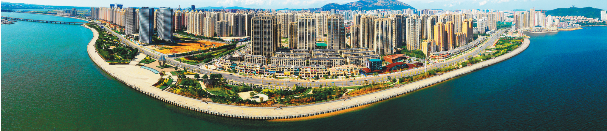
金普新区南部滨海大道城市景观。