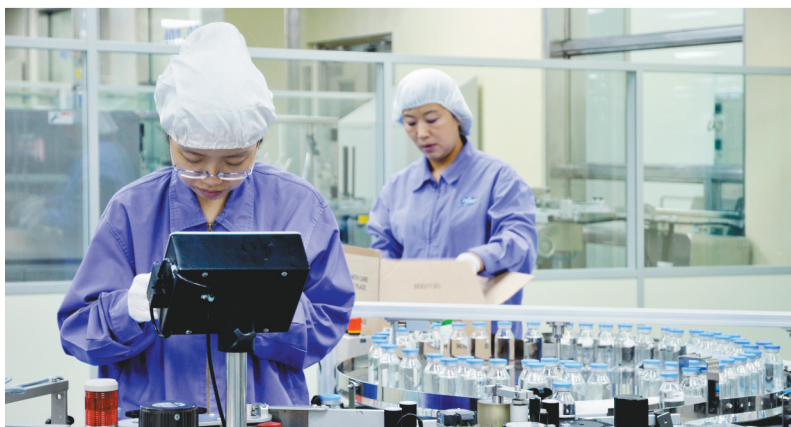
大连辉瑞制药有限公司质检人员在对产品进行检测。

随着博澳精密新能源汽车零部件、信基智能装备产业园、林德加氢站设备等项目相继落户,华为人工智能计算中心、大连数谷等项目全面启动,一批标志性产业链和先进制造业、现代服务业集群的集聚,将加快金普新区建设成为东北地区产业高质量发展样板区。