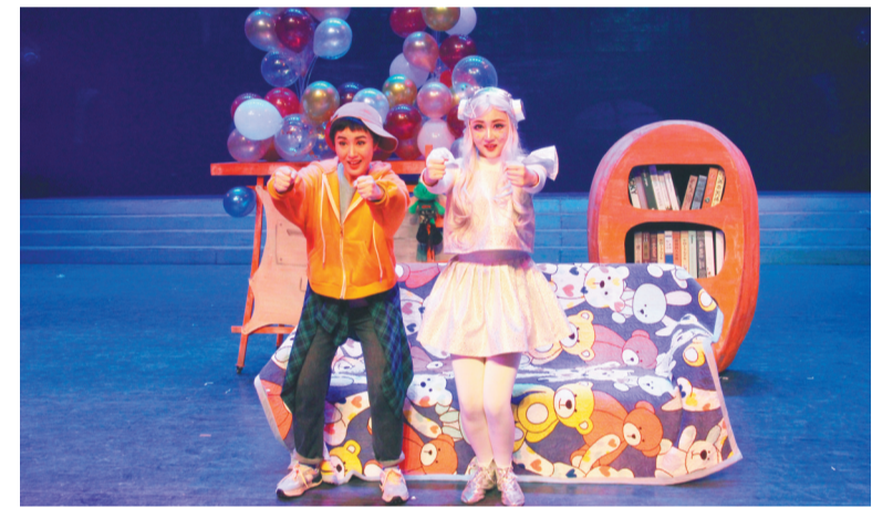
童话剧《黑暗城堡历险记》。

本报讯 记者杨亮报道 12月12日,大型童话剧《黑暗城堡历险记》在盛京大剧院歌剧厅上演。这是继《勇敢的心》之后,沈阳演艺集团、沈阳歌舞团、沈阳曲艺团推出的2021年第二部魔幻系列童话剧。