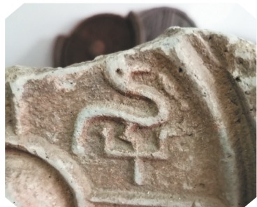
瓦当上的“千”字设计成小鸟衔虫。