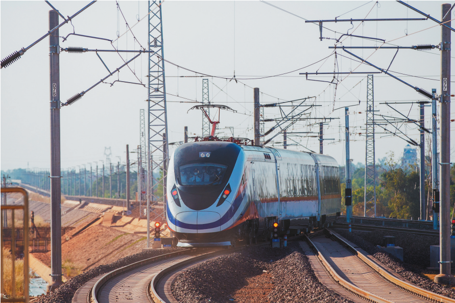
12月3日,“澜沧号”动车组列车驶离老挝万象站。

为确保中老铁路开通运营安全、稳定运行,中国中车统筹组织,中车大连公司牵头、中车四方股份公司协同、相关配套