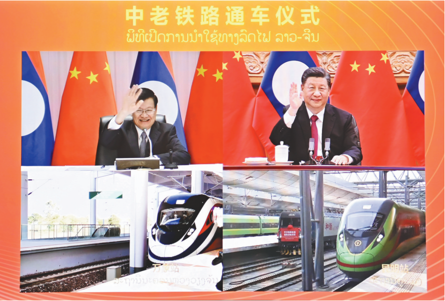
12月3日下午,中共中央总书记、国家主席习近平在北京同老挝人民革命党中央总书记、国家主席通伦通过视频连线共同出席中老铁路通车仪式。

习近平强调,为人民服务是中老两党的共同宗旨,中老关系也要突出人民至上,更多更好惠及两国民众。中方将继续向老方提供新冠疫苗、抗疫物资等支持,加强医疗、农村扶贫合作,深化青年、文化、地方交流,增进两国民众的获得感和幸福感。中方愿同老方一道,践行真正的