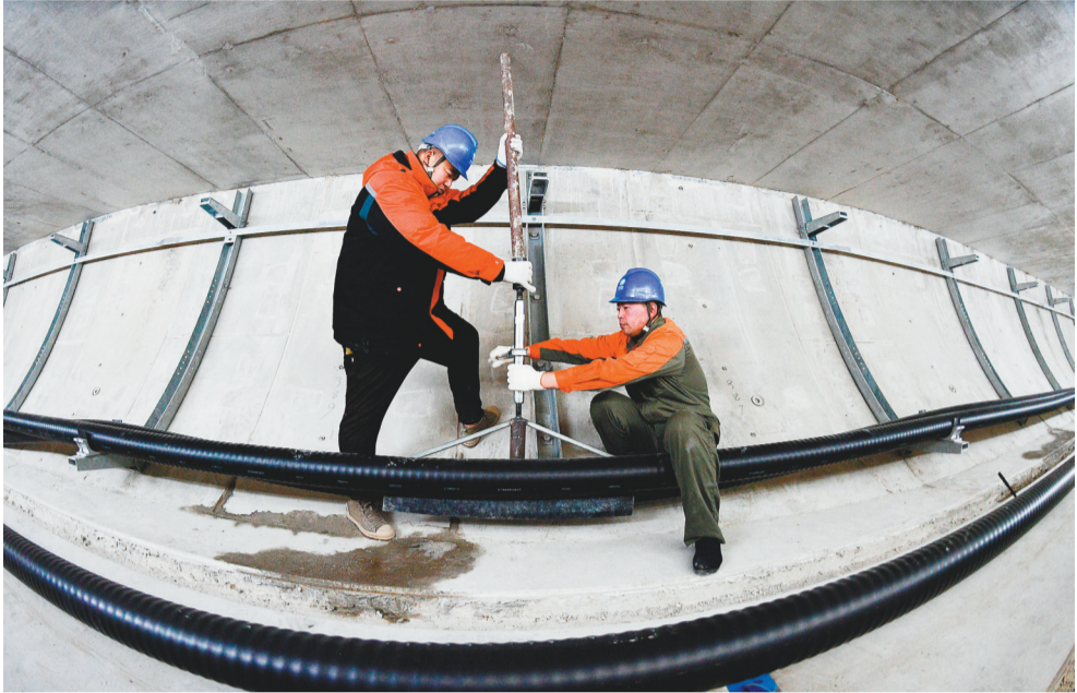
220千伏盛京-湾江电缆线路工程施工人员在第三区间采用垂直“S”形技术敷设电缆。

今年以来,国网辽宁省电力有限公司围绕高质量发展主旋律,以服务辽宁全面振兴、全方位振兴为己任,加快配电网建设,建设坚强电网,优化网架结构,提高供电能力,为地方经济发展提供可靠电力保障。