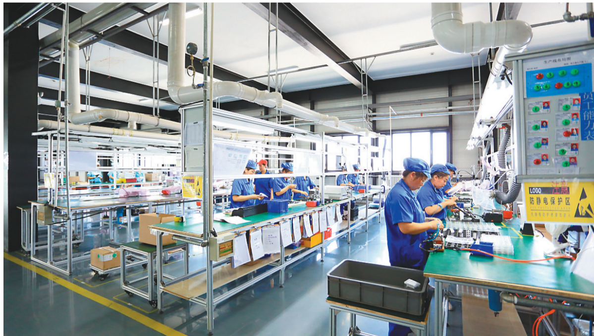
得益于良好的营商环境,安费诺三浦(辽宁)汽车电子有限公司生产形势不断向好。

前三季度,全市制造业规模以上工业增加值同比增长23.9%,制造业增加值占全市规模以上工业增加值比重达到50.3%,较上一年同期提高10个百分点,产业结构逐步优化。