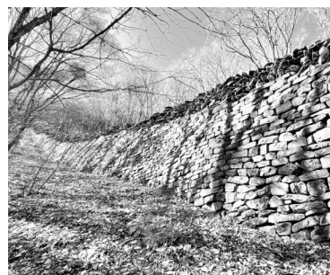
五女山山城城墙。

为全面提升大遗址保护管理和利用水平,日前,国家文物局制定印发了《大遗址保护利用“十四五”专项规划》,提出到2025年,大遗址保护利用总体格局基本成型的总目标。在公布的“十四五”时期全国各省、自治区、直辖市共145处大遗址名单中,我省有3处大遗址上榜,分别是牛河梁遗址、高句丽遗址(凤凰山山城、五女山山城)、三燕龙城遗址。此外,在跨省、自治区、直辖市的大遗址中,我省还有长城国家文化公园辽宁段建设项目入选。