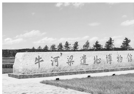
牛河梁遗址博物馆。