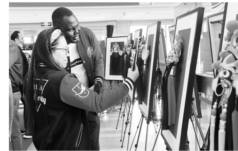
在吉林大学巡展时,宣纸脱胎戏曲脸谱吸引外国留学生。