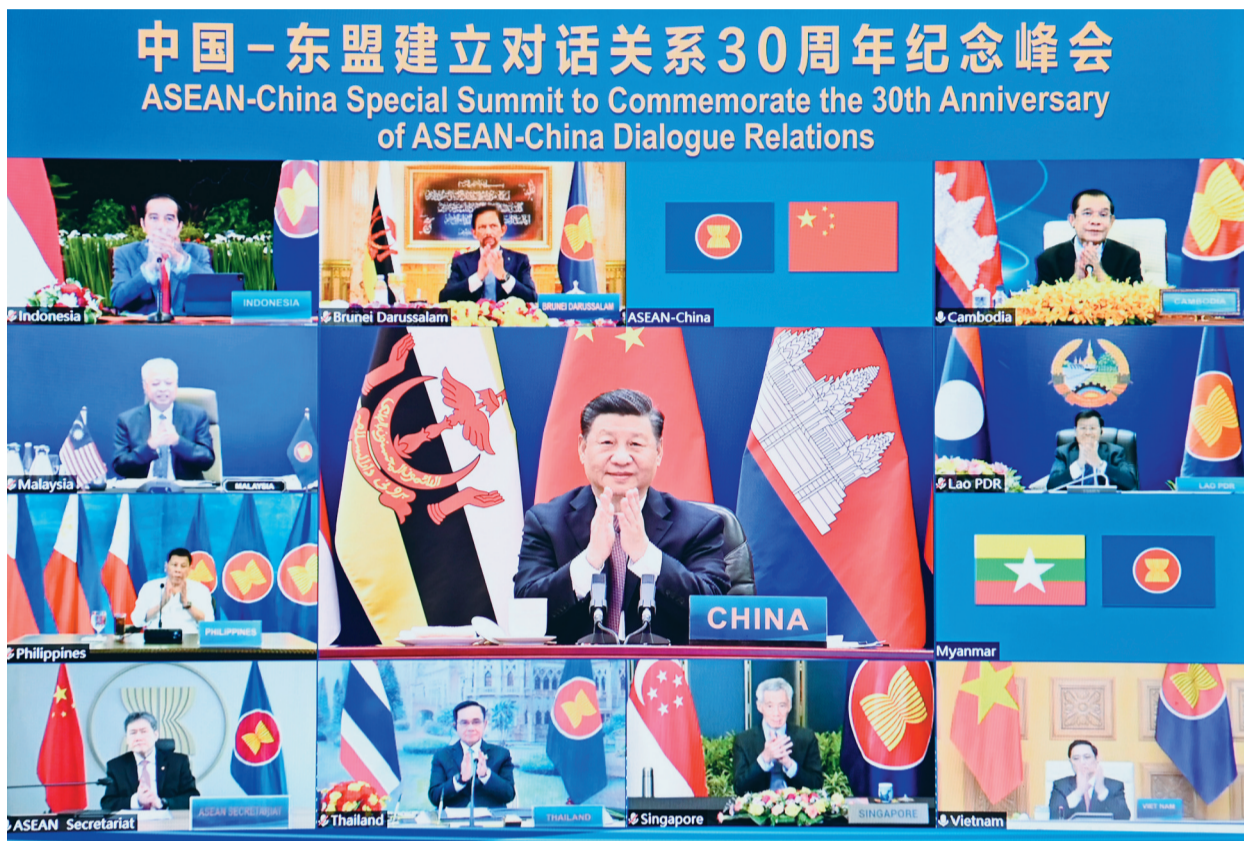
11月22日上午,国家主席习近平在北京以视频方式出席并主持中国-东盟建立对话关系30周年纪念峰会,发表题为《命运与共 共建家园》的重要讲话。中国东盟正式宣布建立中国东盟全面战略伙伴关系。

新华社北京11月22日电(记者杨依军)国家主席习近平22日上午在北京以视频方式出席并主持中国-东盟建立对话关系30周年纪念峰会。中国东盟正式宣布建立中国东盟全面战略伙伴关系。习近平发表题为《命运与共 共建家园》的重要讲话。习近平指出,中国东盟建立对话关系30年来,走过了不平凡的历程。这30年,是经济全球化深入发展、国际格局深刻演变的30年,是中国和东盟把握时代机遇、实现双方关系跨越式发展的30年。我们摆脱冷战阴霾,共同维护地区稳定。我们引领东亚经济一体化,促进共同发展繁荣,让20多亿民众过上了更好生活。我们走出一条睦邻友好、合作共赢的光明大道,迈向日益紧密的命运共同体,为推动人类进步事业作出了重要贡献。