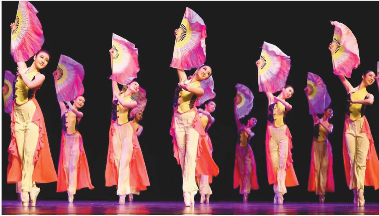
舞蹈《茉莉花》演出照。

核心提示 11月22日,记者从辽宁芭蕾舞团了解到,该团本年度对外文化交流工作即将完成,目前,辽宁芭蕾舞团正在进行对外艺术培训收尾工作。据了解,辽宁芭蕾舞团艺术中心刚刚结束舞蹈教学视频课程录制工作,为蒙古国提供37堂舞蹈培训视频课程,用于当地民众学习舞蹈。近年来,辽宁芭蕾舞团对外文化交流成果丰硕,辽宁芭蕾舞团一方面坚持原创舞剧,另一方面持续与国外著名舞团及编导联合创作舞蹈作品,赴五大洲巡演,以芭蕾为载体,讲述中国故事。由于成绩显著,辽宁芭蕾舞团多次受到表彰。其中,辽宁芭蕾舞团原创舞剧《花木兰》入选“中华文化走出去”重点推介项目。