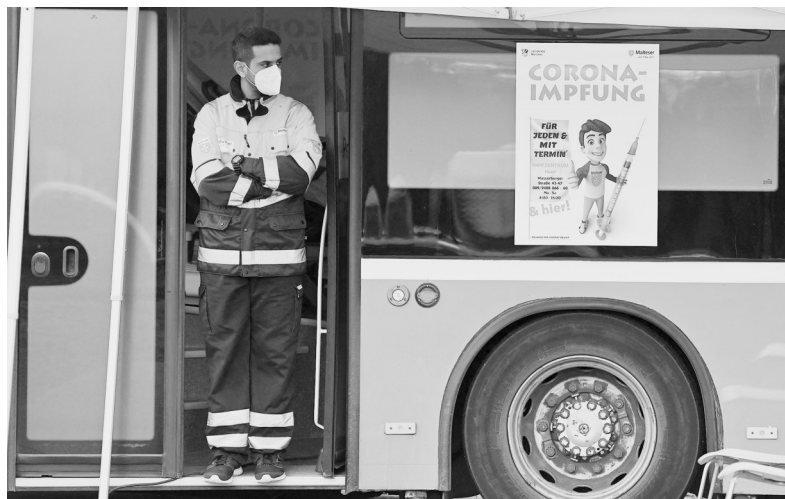
图为在德国慕尼黑附近,医务人员在疫苗接种车上等候。

韩国中央防疫对策本部17日通报,截至当天零时,韩国较前一日新增新冠确诊病例3187例,为疫情暴发以来第二高,累计确诊402775例。现有新冠重症患者522人,为疫情以来最高纪录。