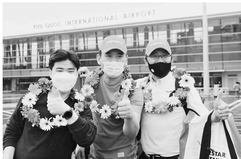
11月20日,游客在越南富国岛国际机场合影。继泰国、印度尼西亚、柬埔寨等国陆续放宽入境防疫限制后,越南富国岛20日迎来两百多名游客。据外媒报道,这是近两年来首批入境越南的外国游客。