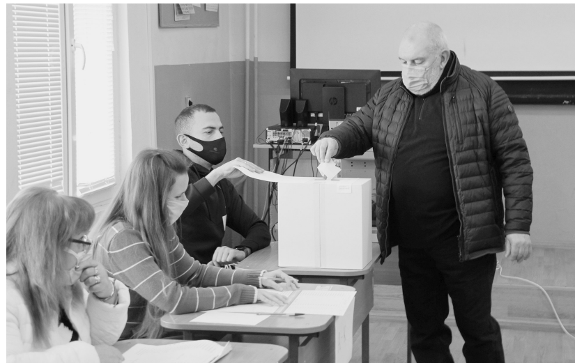
图为一名选民在保加利亚索非亚一处投票站投票。

根据保加利亚宪法,总统由选民直选产生,任期5年,可连任一次。拉德夫在2016年11月举行的总统选举中获胜,于2017年1月就任保加利亚总统。他的任期将于2022年1月结束。