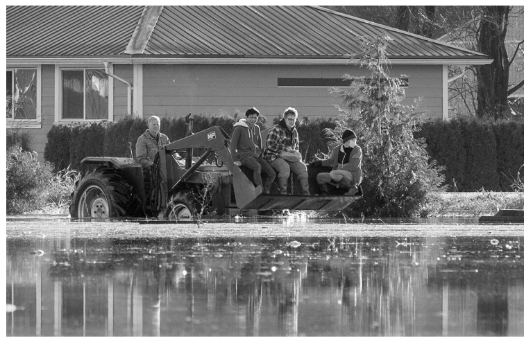
11月19日,人们在加拿大不列颠哥伦比亚省乘拖拉机经过被洪水淹没的区域。加拿大西部不列颠哥伦比亚省过去一周遭遇暴雨引发的洪水和泥石流灾害。省政府19日宣布,部分地区暂时限制民众在加油站的加油量,并禁止城际公路上的非必要出行。