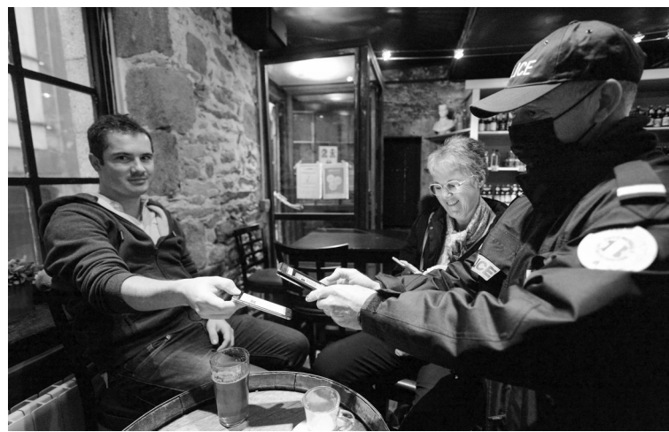
11月19日,警察在法国圣马洛的一家酒吧检查顾客的健康通行证。近期法国经历疫情反弹,18日,法国报告新增新冠确诊病例超2万例。