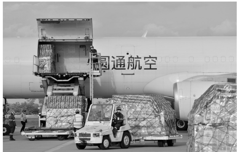
11月17日,在老挝万象机场,工作人员卸载并装运中国援助的新冠疫苗等物资。中国援助老挝新一批新冠疫苗17日运抵万象机场。